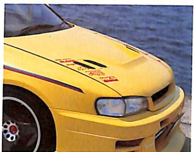
←FRP製のエアロボンネットもインパクト大。大小5箇所もタクトが開けられ、エンジン内にもった熱を逃がす