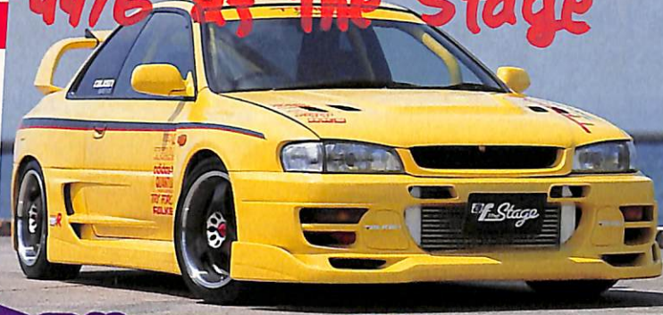
→イエローにオールペンされたこのクルマには、もはやインプレッサらしさは見当たらない。ベース車としては超A級難度のインプレッサだが、コンプリートだけあって完成度は高い