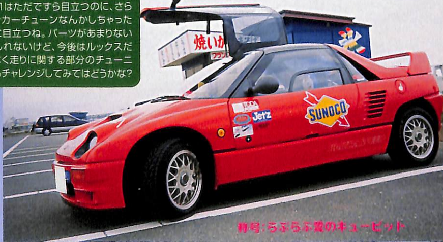
称号:ちびろお嬢のキュービット

♡8月号に載せてもらってからAZ-1マツダスピード仕様は色々なショップのデモカーみたいに派手になりました。しかし、ワケわかんないでしょ(笑)。これからも安全運転しまーす。 ♡AZ-1はただですら目立つのに、さらにステッカーチューンなんかしちゃったら余計に目立つね。パーツがあまりないのかもしれないけど、今後はルックスだけじゃなく走りに関する部分のチューニングにもチャレンジしてみてもどうかな?