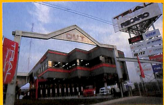
はっちり目立つてっかい看板が目印。

新TRIAL 住所:大阪府南河内郡美原町丹上87-1 問:0723-69-3539 営業時間:平日10:00~20:00 日祝日11:00~19:00 定休日:毎週水曜