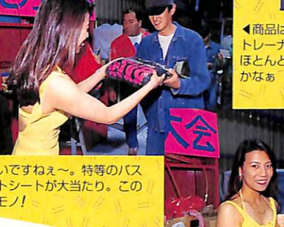
◀いいですねえ〜。特等のパ ケットシートが大当たり。この 幸せモノ!