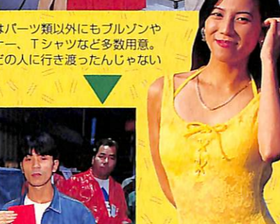
◀商品はパーツ類以外にもブルゾンや トレーナー、Tシャツなど多数用意。 ほとんどの人に行き渡ったんじゃない かなあ