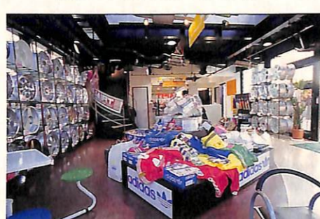
▲明るい雰囲気の内には、1階はアルミホイール、 2階はGTパーツやオーディオなど中心に豊富なライ ンアップがされる。また、ウェアやシューズなどの オリジナルグッズも陳列されている!