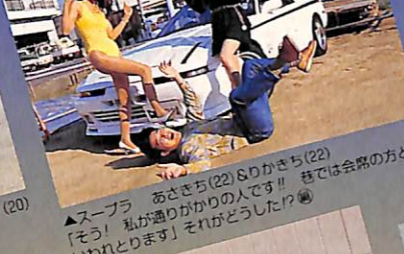
▲スーブラ あさき(22) & Oかし(22) 「そう! 私が過りかかっている!! 昔では会席の方とも いれどります」それがどうした!?