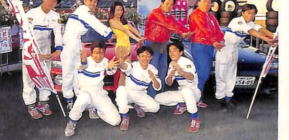
▲キミたちを出迎えてくれる明るく元気のいいスタッフたち。 元気があすぎて後ろのデモカーが隠れちゃってます!