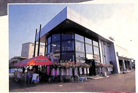
▲国道2号線沿いにある、ムッチャオシャレなコノ建物が トライアル神戸店なのだ!!

みなさん、こんにちは。2回目を迎えた「みっちゃんのショップだいすき」は今回、兵庫県明石市にあるトライアル神戸店に行ってきました。こちらのショップは、10月6日にそれまでの仮店舗から、洒落た新店舗に移転したばかり。そのオープニングセール真っ最中のところをお邪魔してきちゃいました。 トライアル神戸店には、「楽しい走り」をモットーにするスカイライン、シルビア、セブンなどのスポーティカーオーナーたちが、それぞれのクルマにこだわりを持って集まってくる。そんな彼らの熱い要望にも、こだわりの商品ラインアップや、アライメントテスターから、愛車の馬力を測ってくれるシャーシダイナモまで揃ったピット設備&頼もしいスタッフなどの万全の態勢で応えてくれるよ。 また、トライアルでは、市販車ベースのレースの中で最もキビシイといわれるN1耐久レースをはじめ、様々なレースに積極的に参加し、そこで得た数々のノウハウを商品にフィードバックしているそうよ。だから、みんなも現在の愛車の不満点をピンピン、スタッフにぶつけてみよう。きっと満足できるチューニングメニューが見つかるはずよ。 最後にお店からのお知らせだよ。トライアル神戸店では、11月末から年末にかけてビッグなキャンペーンを行うから、見逃したら絶対に損だぞ。ひょっとしたらトライアル神戸店からビッグなボーナスがある! ...かもネ?