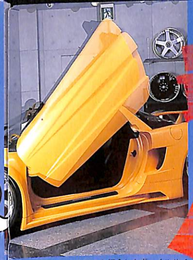
3月号でも紹介したウェールサイドのミスティ・NSXに、エアシリンダーを使った自動開閉システムが装備された! インパクト激甚!!