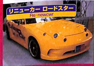
リニューカー ロードスター Re-newcwr

中古車ベースにイジる。僕らに近いクルマ。 ■リニューカーの展示車は、どれも中古車ベースのモディファイ。それでいて充分な存在感がある。