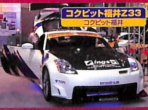
コックピット福井Z33 コックピット福井

■SUNOCOがAN-TECH R&Dと共同開発で造った、楽しめるシルビア。レースカーっぽい迫力のボディだが、公認車検をクリアしたスペシャルなマシンだ。しかしフェンダーが渋ッ!!