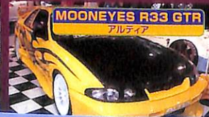
MOONEYES R33 GTR アルティマ