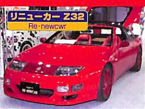
リニューカー Z32 Re-newcwr