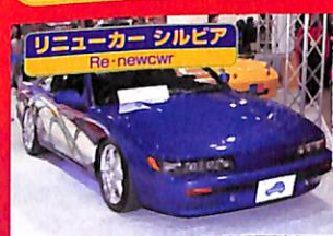
リニューカー シルビア Re-newcwr