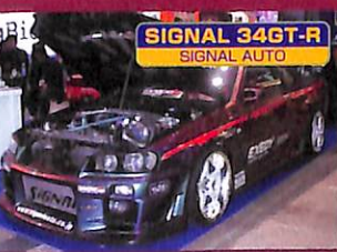
SIGNAL 34GT-R SIGNAL AUTO