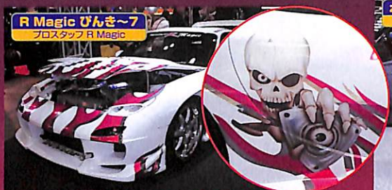
R-Magic ぴんき〜7 プロスタッフ R-Magic

■ボディに貼り付けるグラフィックデカールは、アピールにはもってこいの効果的手段。そんなグラフィックも、時代とともにワントーンのスリムラインから、今やフルカラーのCGグラフィックへ移り変わってきている。イラストのテーマはもちろん、ドコにどう貼れば効果的なのかアイデアも膨らむね。グラフィックはこれからますます熱くなっていくモディファイだ。