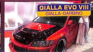
GIALLA EVO VIII GIALLA-GARBINO