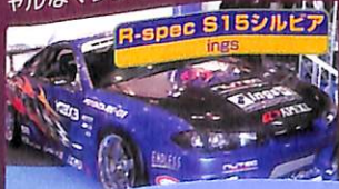
R-spec S15シルビア ings

工、強化メタルガステクト、強化ヘッドボルト、鍛造ピストン、フルバランス軽量、GT15Sタービンなどで200馬力オーバーを発揮するハードなコンバットFFスポーツ!