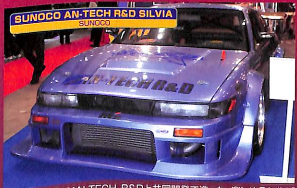
SUNOCO AN-TECH R&D SILVIA SUNOCO

■SUNOCOがAN-TECH R&Dと共同開発で造った、楽しめるシルビア。レースカーっぽい迫力のボディだが、公認車検をクリアしたスペシャルなマシンだ。しかしフェンダーが渋ッ!!