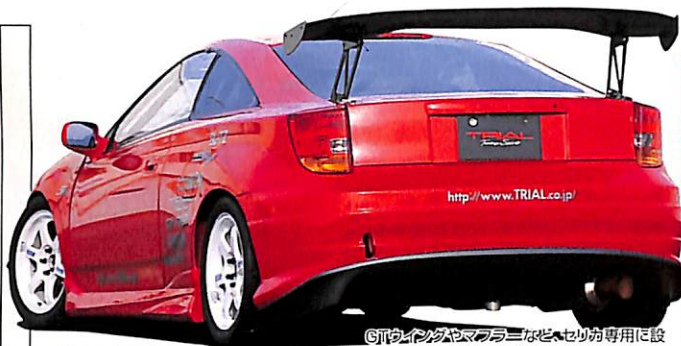
⑥ブレーキやマフラーなどはセリカ専用設計されたパーツや、ワンオフパーツも多数使用。