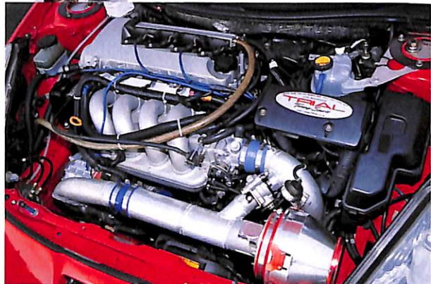
ブリックのスーパーチャージャーでブリストン0.4kg/cm 2 時に283ps/277kgmを発生。制御はメインCPにパワーFCサブCPにVプロを使用している。

SPEC POWER 283ps 7760rpm (実測) ENGINE&DRIVE-TRAIN BLITZスーパーチャージャー/オリジナルコンロッド、バルブ/BOSCH燃料ポンプ/オリジナルエキマニ、マフラー/APEXパワーFC/HKS F-CON Vプロ/ワンオフインタークーラー/オリジナル3層ラジエーター/BLITZインタークーラー、アクティブクランチ、フライホイール/TRD LSD SUSPENSION クワンタム試作車高調&アイバックスプリング(F18k・R18k)/TRDスタビライザー/オリジナルブレーキキャリパー&ローター TIRE&WHEEL ヨコハマA048(F225/45-16・R225/45-16)/レイステ37(F8.0J+35・R8.0J+35) THE OTHER トライフォースエアロキット/ワンオフロールバー/スポット増し/レカロSP-G