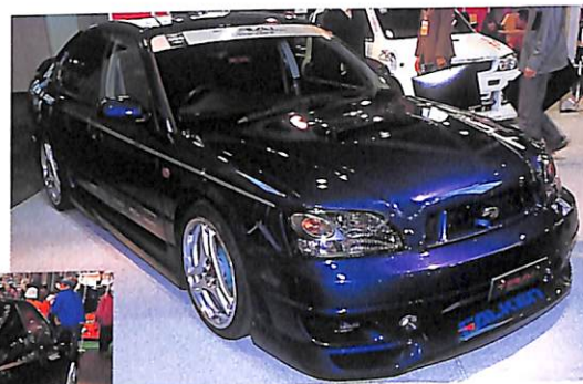
インプレッサと同じボクサーエンジンを搭載するレガシイ。スポーツセダンをアピールするそのエアロは、曲線を使い効率的にエアを流すフォルム。