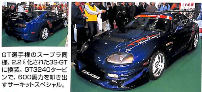
GT選手権のスーパー同様、2.2ℓ化された3S-GTに換装。GT3240タービンで、600馬力を叩き出すサーキットスペシャル。