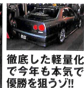
徹底した軽量化で今年も本気で優勝を狙うゾ!!