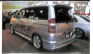
新型ノアにC10コンプレッサーをセット。200馬力と27キロのトルクでミニバンとは思えない走りを実現。装着されるZ3アルミは4月に発売予定。