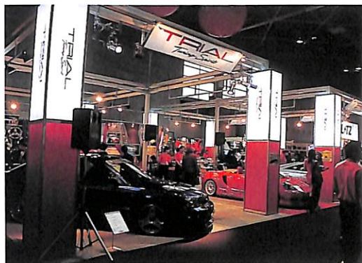
エアロからチューンまでトータルでプロデュースするトリアル。チューンの相談会も開催。