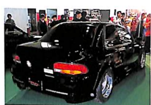
1ZZ、2ZZエンジンを2ℓ化する3ZZキット。ノーマルのトルク不足を解消し、余裕の走りを実現してくれる。