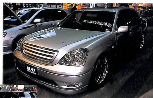
美しさと速さの両立をコンセプトに、エンジンからサスペンション、スタイルに至るまでトータルでコーディネートされたセルシオ。