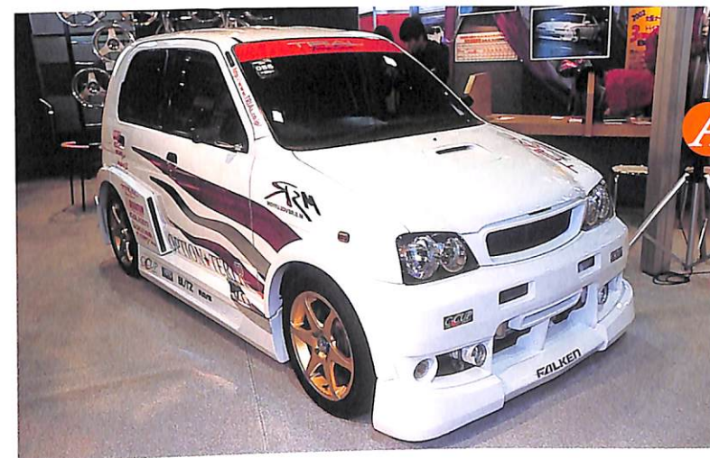
DTMマシンを彷彿させるマッチョなフォルムはC-CUPIによるモノ。1.3ℓエンジンを換装し、Kカーとは思えない走りを実現。