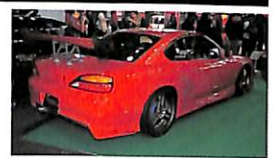
ノーマルの精悍なイメージは崩さぬよう、よりレーシーに生まれ変わるトライフォースは、機能も追求したレーシングエアロ。