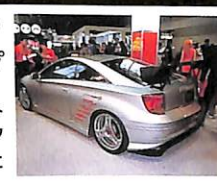
エンジンはオリジナル3ZZキットで2ℓ化。エクステリアはトライフォースエアロにGTウイングをまとい、精悍なフォルムを作る。