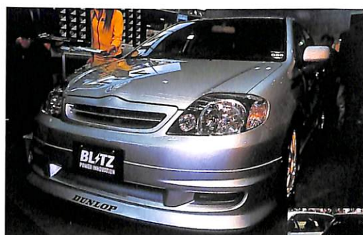
ユーロテイストを盛り込んだエアロをまとったランクス。オリジナルC12コンプレッサーを装着し248馬力を達成する。