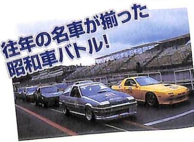
ハコスカやケンメリなどが参加していた昭和車バトル。FCもこのカテゴリーに含まれるあたり、なんとなく感慨深いものがあります