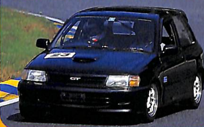
EP82 村田 悟サン

マシンDATA ベースエンジン:EP91 PXエンジンアリング・コンピュータフォルザ・エアクリナー 五次元・ポーター304マフラー FC3S用インタークーラー トラスト・オイルクーラー/ブーストコントローラー カローラII用ラジエター TRD・クラッチ ATS・デフ ショック:Aスペック スコ・アップ・マウント SEI-C Sブレーキパッド TRD・ブレーキホース RE640S(195/60)