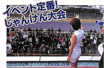
サーキットイベントといえば、何はなくともジャンケン大会。各ショップ持ち寄りの豪華な賞品を賭けて、みんな一喜一憂してたゾ

ザーのうち1分49秒999以下のタイム所持者ばかりで争われる、「TIマスターズ」、ショートサーキットで争われる、「昭和車バトル」などなど、チューニング好きにはたまらないレースがメジロ押し。好レースひしめくなか、今回は注目のショップが揃い踏みしたチューナーズバトルと有力ユーザーが多数参加したTIマスターズに焦点を絞ってレポートしよう!