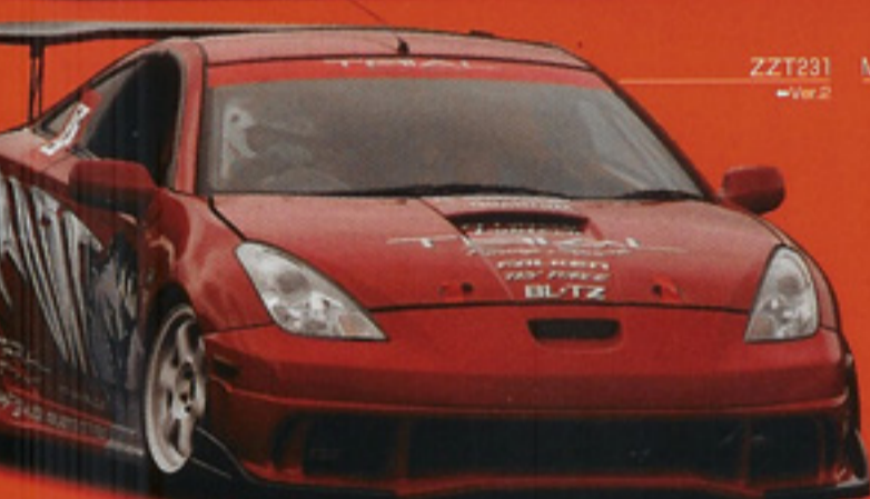
ZZT231 MR-S Ver.2