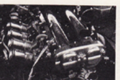
1600NAチューンで最速に挑むトライアル。81番ピストンで1722ccにアップ。4連スロットルでトルクとパワーを絞り出す。今回はヘッドにスペシャル加工を施しており、未知数のポテンシャルを秘めている。

フルチューンロードスター3台が、筑波で最速バトル対決を敢行するぞ。 シヨップのヨロ意気は大拍手!